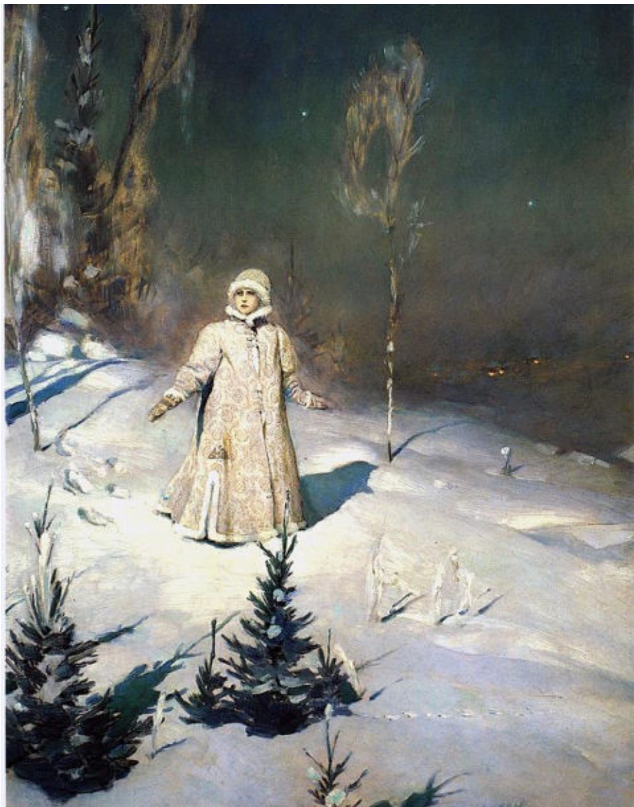
«Снегурочка», В.М. Васнецов