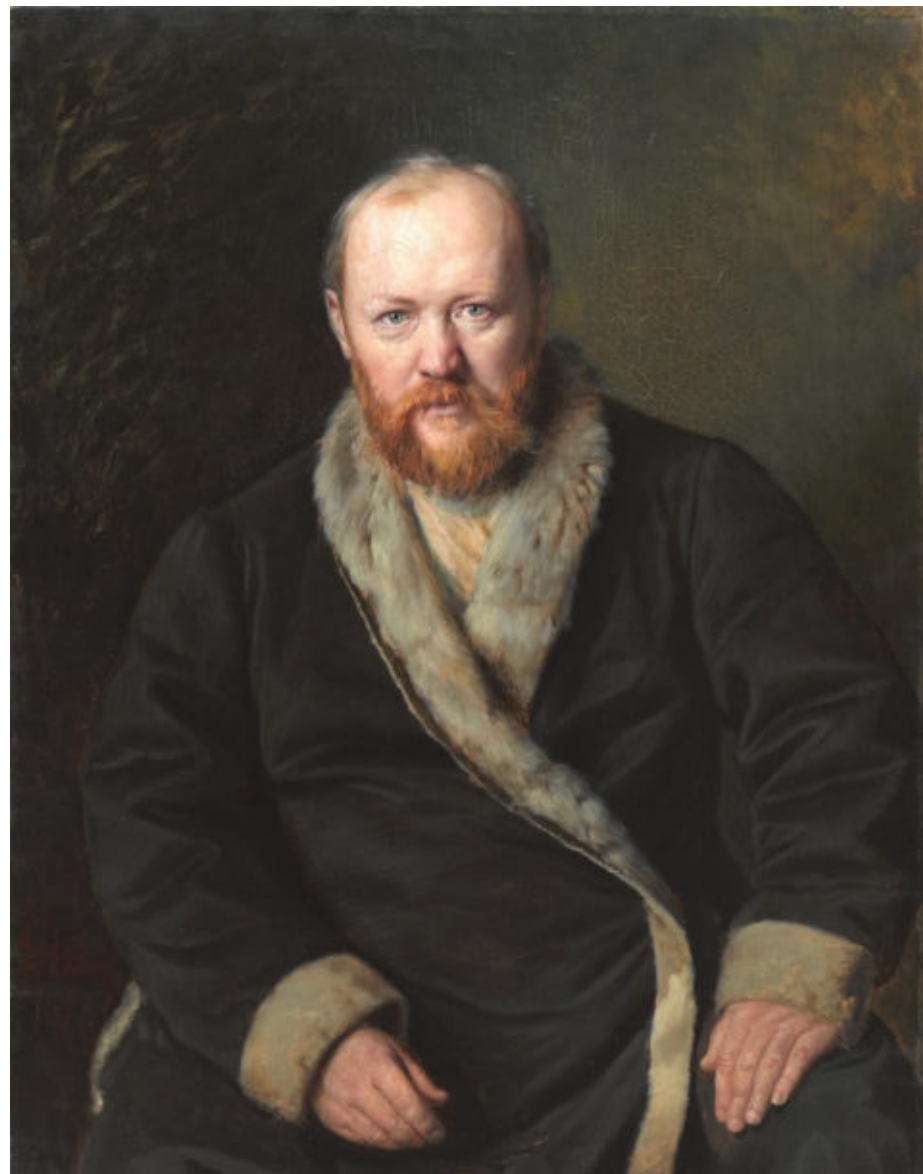
А. Н. Островский (1823-1886)