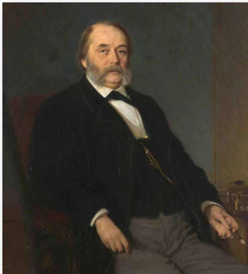
И.А. Гончаров (1812-1891)

«Литературе Вы принесли в дар целую библиотеку художественных произведений, для сцены создали свой особый мир. Вы один достроили здание, в основание которого положили краеугольные камни Фонвизин, Грибоедов, Гоголь»