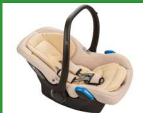
Автокресло группы 0+ для детей массой менее 13 кг