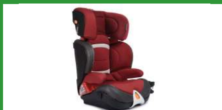
Автокресло группы III для детей массой 22-36 кг (возможно использование бустера)