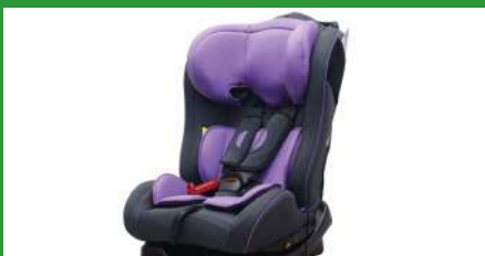
Автокресло группы II для детей массой 15-25 кг