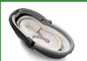
Автокресло «люлька» группы 0 для детей массой менее 10 кг

Детские удерживающие устройства подразделяют на 5 весовых групп: