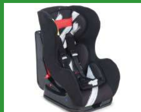
Автокресло группы I для детей массой 9-18 кг